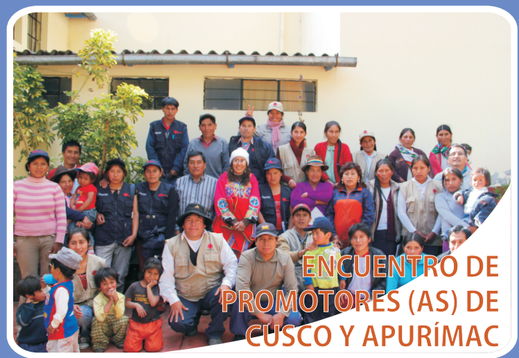
ENCUENTRO DE PROMOTORES (AS) DE CUSCO Y APURÍMAC