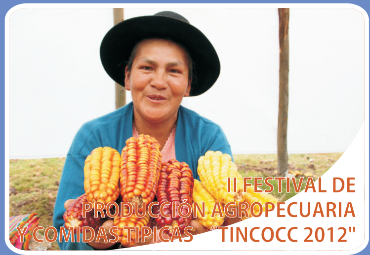
II FESTIVAL DE PRODUCCIÓN AGROPECUARIA Y COMIDAS TÍPICAS "TINCOCC 2012"