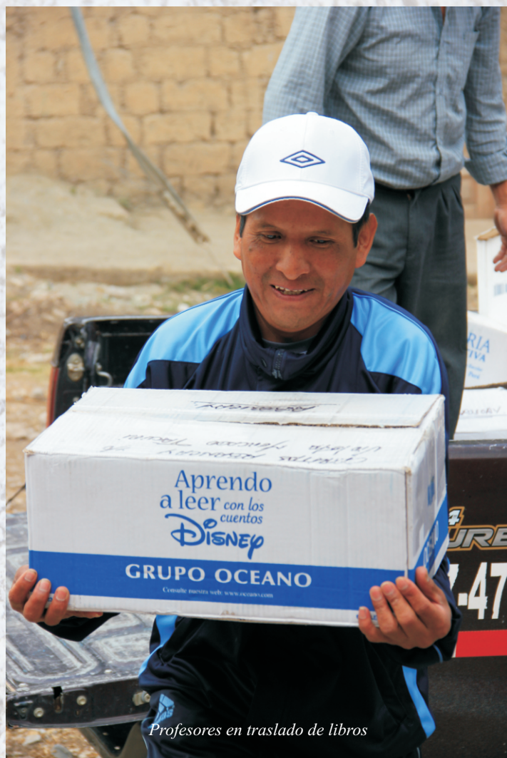
Profesores en traslado de libros

Los directores, docentes y personal auxiliar de ambas I.E., participan activamente en desarrollo y avance de todas las actividades programadas, que en lo futuro redundará en beneficio de cientos de niños y jóvenes de la Provincia de Abancay.