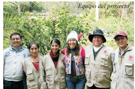
Equipo del proyecto

Demostraron liderazgo por las/los lideres comunales, especialmente las mujeres, los resultados del evento fueron impresionantes desde la capacidad de liderazgo de las promotores/as en la capacidad de desenvolverse y compartir estas experiencias, teniendo en cuenta que la Coordinadora del Proyecto conoció como empezaron estas promotoras y en la actualidad que cambios sustanciales han demostrado y es mas han ido mejorando los registros de control de los niños ( promotoras de salud de Marjuni y Uripipampa), donde los/las lideres de Checacupe reconocieron dichos avances y felicitaron por compartirlos.