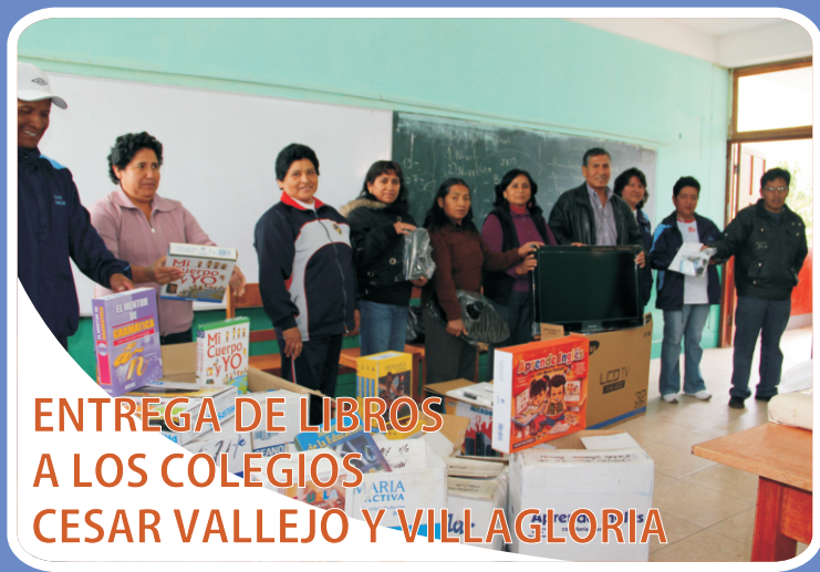
ENTREGA DE LIBROS A LOS COLEGIOS CESAR VALLEJO Y VILLAGLORIA