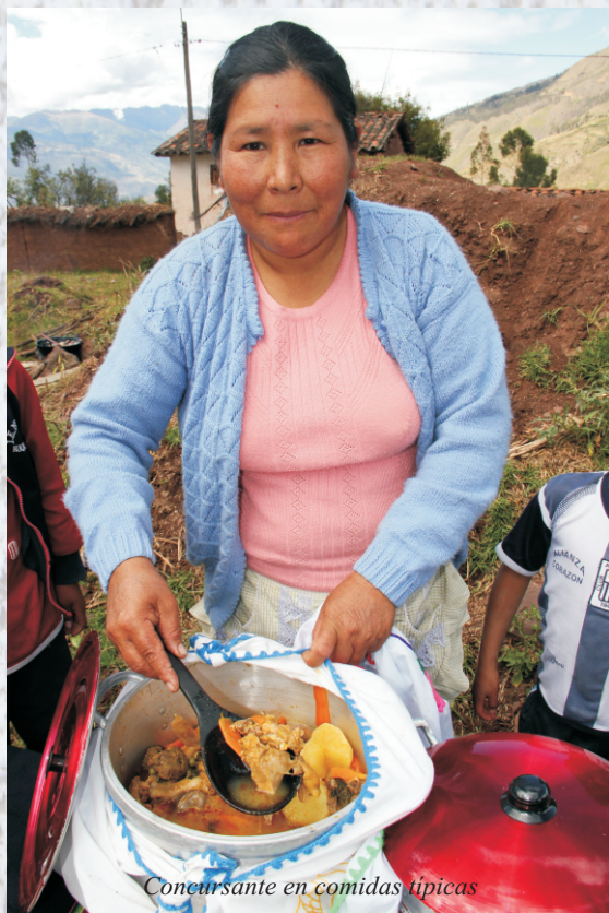
Concursante en comidas típicas

Paralelo a la calificación de la producción de leche se ha realizado la calificación de los derivados lácteos preparados y presentados por cada uno de los comités de productores de ganado vacuno, productores individuales y organizaciones participantes, para ello los jurados integrado por profesionales del ISTP. de Huancarama de la carrera de industrias alimentarias procedieron a la calificación de la variedad de derivados como