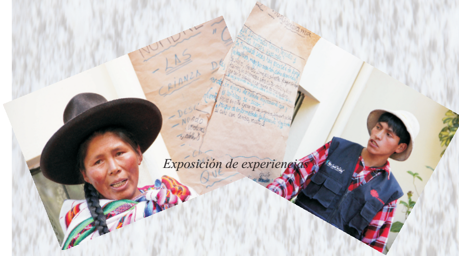
Exposición de experiencias