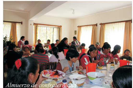
Almuerzo de confraternidad

Dicho encuentro se realizo en la fase final del proyecto (culminara el 30 de Junio), en ella se tuvo espacios de reflexión conjunta, en el cual analizamos los logros, dificultades y soluciones a inconvenientes, las metodologías y estrategias utilizadas, para poder inter cambiar las experiencias exitosas y aprender de las no tan exitosas y poderlas utilizar en futuras intervenciones y como las autoridades se han involucrado en este proceso.