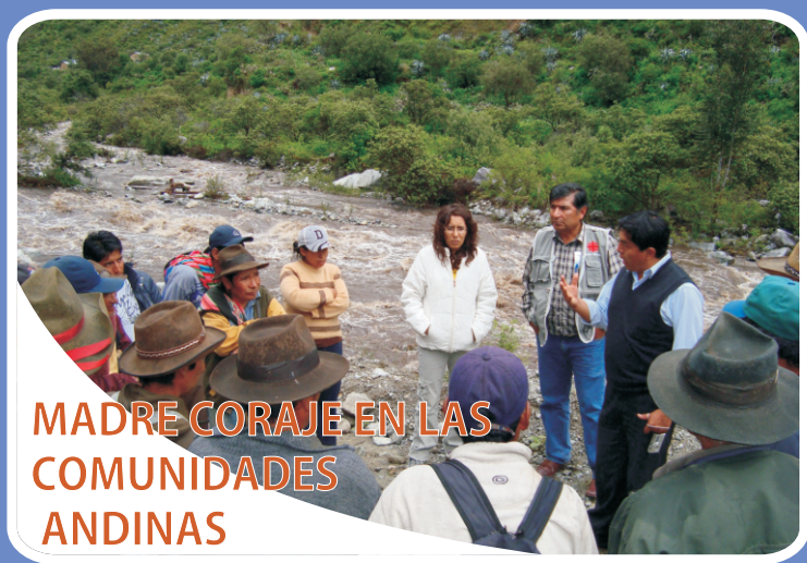
MADRE CORAJE EN LAS COMUNIDADES ANDINAS