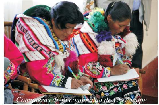
Comuneras de la comunidad de Checacupe

participaron 14 lideres del Distrito de Checacupe, entre autoridades de la Municipalidad Distrital y lideres de las comunidades de Llocllora y Ocobamba( acompañadas por el equipo tecnico de Caritas Cusco) y 14 lideres de las comunidades de Marjuni y Uripipampa,( acompañados por el equipo tecnico de Caritas Abancay), incluido el Sr. Alcalde de la Municipalidad Distrital de Lambrama.