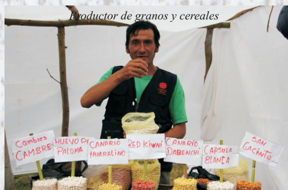
Productor de granos y cereales