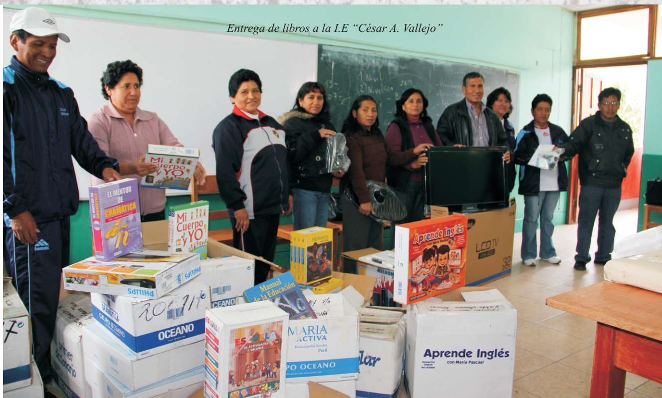
Entrega de libros a la I.E “César A. Vallejo”