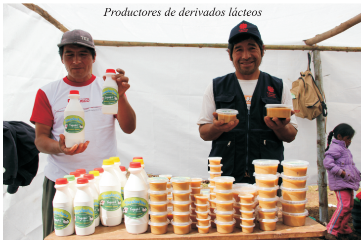
Productores de derivados lácteos